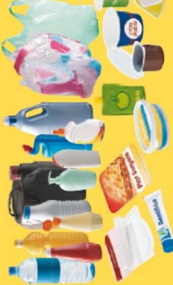
EMBALLAGES EN PLASTIQUE (bouteilles, flacons, sachets, barquettes, boîtes, films...)