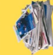
EMBALLAGES EN CARTON & PAPIERS