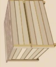
LES BIODÉCHETS dans le COMPOSTEUR ou le PAV BIODÉCHETS

(bouteilles, flacons, sachets, barquettes, boîtes, films...)