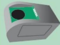
LES CONTENANTS EN VERRE dans le PAV VERRE