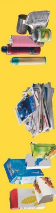
EMBALLAGES EN CARTON & PAPIERS

PAS D'OBJETS que des EMBALLAGES BIEN VIDÉS mais pas lavés PAS IMBRIQUÉS & EN VRAC pas en sac